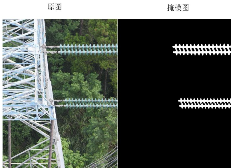
图 1 原图与掩模图对比