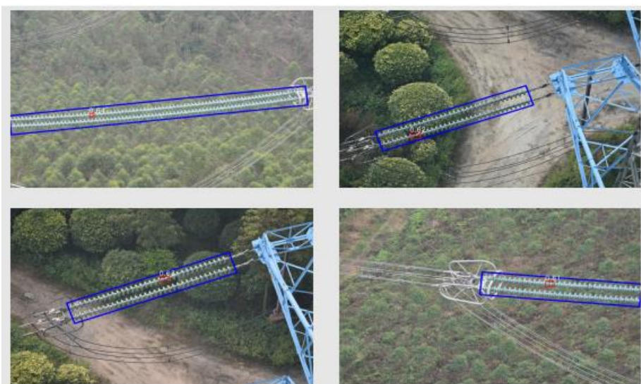
图 2 样例示范

根据分割图像初步识别绝缘子所在的位置，并对绝缘子串珠进行分割，而后参赛者根据所给出的标记样本的 Ground Truth 构建自爆绝缘子识别模型。参赛者利用训练模型对图像中的自爆绝缘子位置进行检测，并利用 BoundingBox 对其进行标记。自爆标记需包括自爆位置周围 2 个完好绝缘子。绝缘子自爆位置标记如图 2 所示。