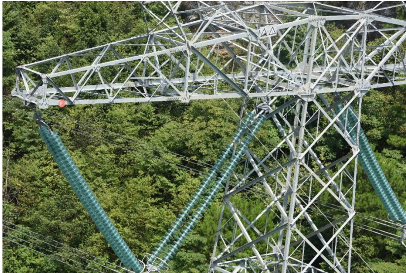
图 3 绝缘子自爆缺陷原图

绝缘子自爆缺陷原图主要是高架线路上拍摄的原图，原图中可能存在自爆点，原图的基本形式如图 3 所示。