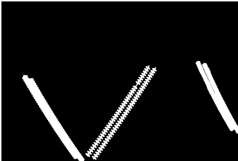
图 4 基于原图的标准掩模图

基于原图的标准掩模图像是使用绝缘子自爆缺陷原图掩模之后的图形，通过掩模的方式可以去除背景，凸显自爆点。基于原图的标准掩模图的基本形式如图 4 所示。